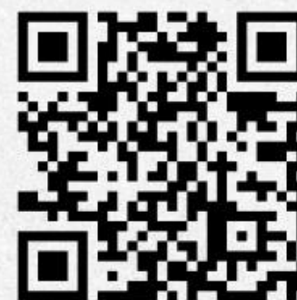
Доклад УНП ООН

В 2020 году пандемия COVID-19 и сопутствующие ей проблемы только усугубили ситуацию. Современные экономические и политические кризисы также вносят свой негативный вклад и являются факторами, которые могут подтолкнуть к употреблению наркотиков большее количество людей.