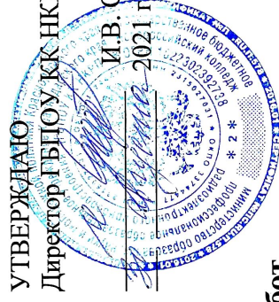
ГРАФИК проведения административных контрольных работ на 2021-2022 учебный год